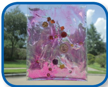
Mirando colores De 3 a 8 meses