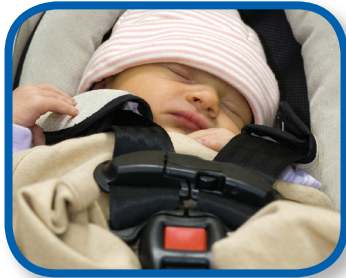
Sin mucho ruido De 0 a 3 meses