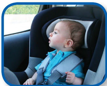
Buscar puntos de referencia De 9 a 12 meses