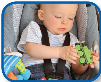
Canasta de diversión De 7 a 12 meses